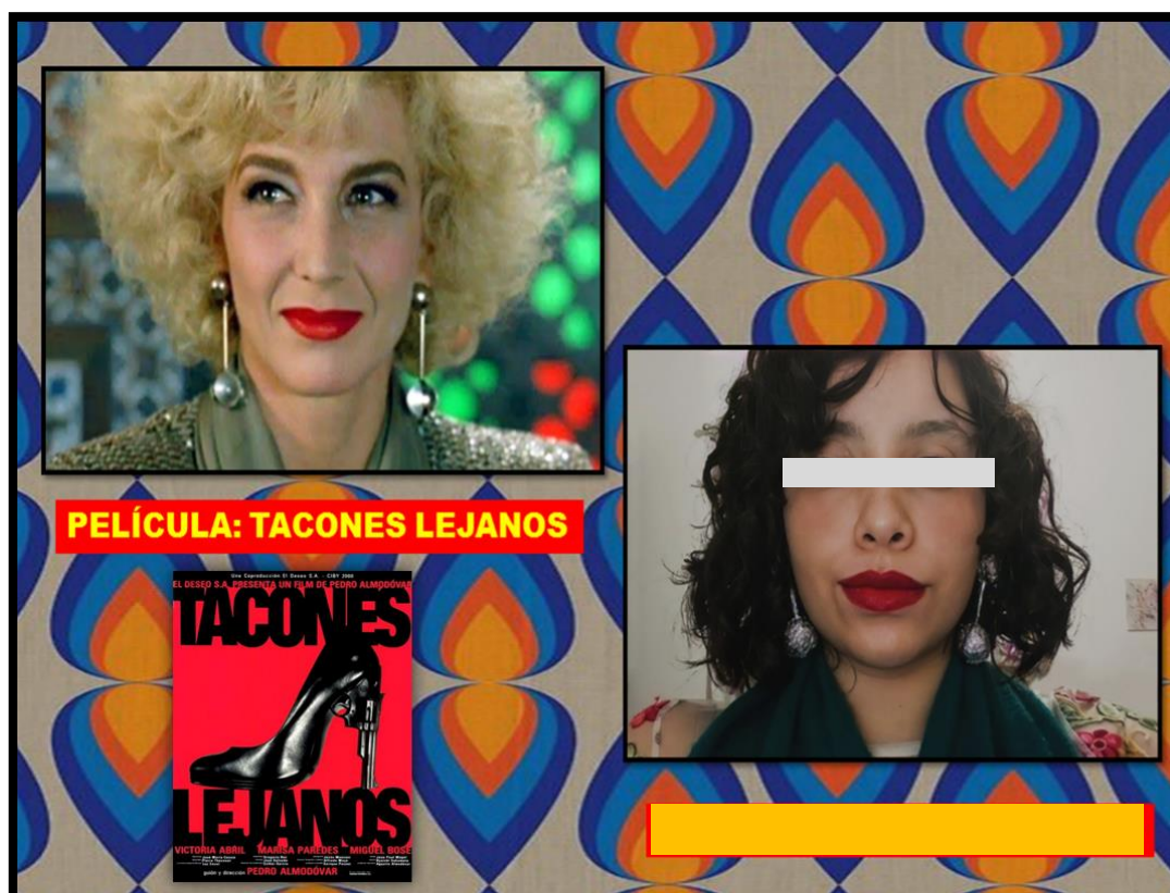
Imagem 4. Fotografias e montagem da aluna

Fonte: Releitura da atriz Marisa Paredes.