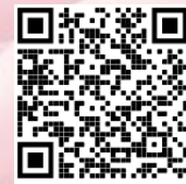
Imagem 5. Carta da aluna C.S.P.S