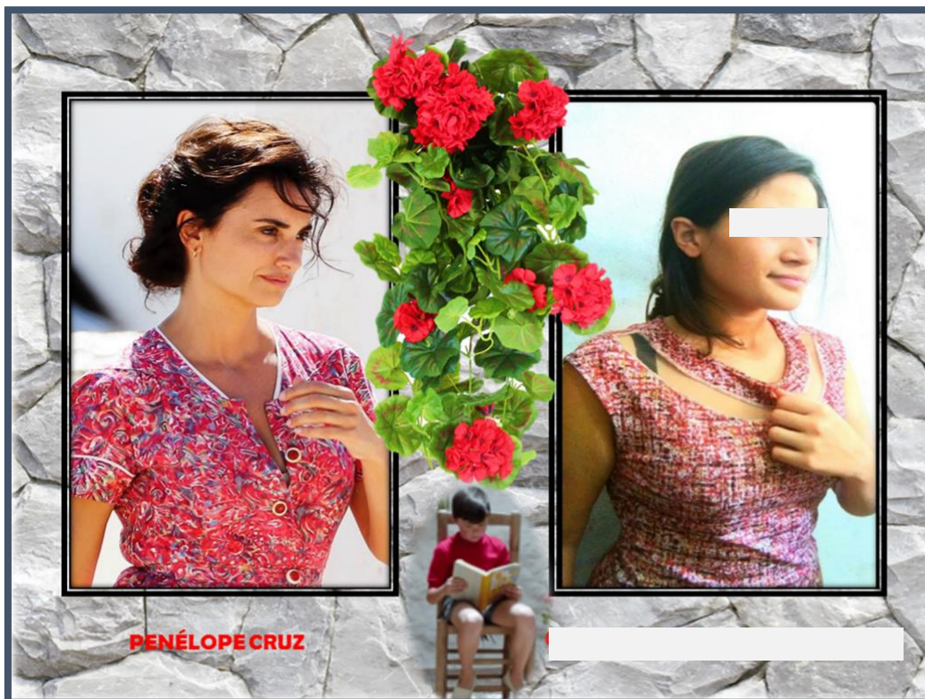
Imagem 6. Releitura da atriz Penélope Cruz, no filme Dolor y Glória.